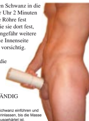
Schwanz einführen und drinlassen, bis die Masse ausgehärtet ist.

4. Führen Sie Ihren erigierten Schwanz in die Röhre ein, bevor auf Ihrer Uhr 2 Minuten abgelaufen sind. Drücken Sie die Röhre fest gegen Ihren Körper und halten Sie sie dort fest, bis die Mischung ganz hart ist (ungefähr weitere 2 Minuten). Falls Ihr Schwanz die Innenseite der Röhre berührt, drehen sie sie vorsichtig. Prüfen Sie mit einem Finger, ob die Mischung komplett ausgehärtet ist, bevor Sie Ihren Schwanz herausziehen. AUF KEINEN FALL HERAUSZIEHEN, BEVOR MISCHUNG VOLLSTÄNDIG AUSGEHÄRTET IST.