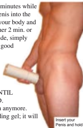
Insert your Penis and hold until gelled

4. Before your timer reaches 2 minutes while standing, insert your erect Penis into the tube. Push the tube firmly against your body and HOLD until the mixture gels (another 2 min. or so). If your Penis is touching the side, simply ROTATE the tube (you'll still get a good mold if you're touching the side). Using your finger, check that the mixture has completely gelled before carefully pulling out your penis. DON'T PULL OUT UNTIL YOU'RE CERTAIN IT'S GELLED. Now relax. There's no need to rush anymore. Don't worry about any spilled molding gel; it will easily clean up with water.