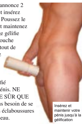
Insérez et maintenez votre pénis jusqu'à la gélification

4. Avant que le chronomètre n'annonce 2 minutes, tenez vous debout et insérez votre pénis en érection dans le tube. Poussez le tube fermement contre votre corps et maintenez la pression jusqu'à ce que le mélange gélifie (environ 2 minutes). Si votre pénis touche un côté, tourner le tube (vous aurez tout de même un bon moule si vous touchez le bord). En utilisant votre doigt, vérifiez que le mélange a complètement gélifié avant de retirer délicatement votre pénis. NE LE RETIREZ PAS AVANT D'ÊTRE SÛR QUE C'EST GÉLIFIÉ. Relaxe-vous. Plus besoin de se dépêcher. Pas de problèmes pour les éclaboussures de gel, elles partiront facilement à l'eau.