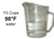
How to use your thermometer to reach 98°F

2. IMPORTANT: Read through steps 2-4 before making your mold 1 1/4 Cups 98°F water Measure out exactly 1 1/4 Cups (425 ml) of 98°F (37°C) water. How to use your thermometer to reach 98°F Hold your thermometer under your tap and adjust the hot & cold until you reach 98°F. Fill to 1 1/4 Cups. Stir up the water and take a final reading to be sure the water is exactly 98°F.