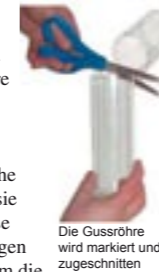
Die Gussröhre wird markiert und zugeschnitten

1. Nehmen Sie den Inhalt des Bausatzes heraus. Halten Sie das VERSCHLOSSENE ENDE der Röhre direkt neben dem voll erigierten Schwanz an Ihren Körper und markieren Sie die Röhre an dem Punkt, an dem er endet. Schneiden Sie die Röhre an dieser Markierung mit einer Schere durch. Kleben Sie dann die entstandene Schnittfläche mit Klebeband ab, um sie glatter zu machen. Diese Öffnung wird später gegen den Körper gedrückt, um die Gussform herzustellen.