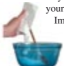
Mix powder and water

3. When Ready to Mold: You have a MAXIMUM of only 2 Minutes to mix the Molding Powder & Water AND insert your Erect Penis Start your timer and pour the 98°F water from your measuring cup into your Mixing bowl. Immediately cut open the bag of Molding Powder and empty the entire contents into the water. MIX WELL with a big spoon or spatula. The mixture will remain slightly lumpy. Carefully pour the entire mixture into your MOLDING TUBE. Scrape with your spoon to get as much out as possible, but keep in mind that this mixture will BEGIN to gel (harden) in only 2 minutes, so be quick! ! Don't hesitate. Within 2 minutes your Penis must be IN the molding tube!