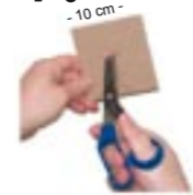
Schneiden Sie ein 'X' in Ihren Karton.

7. Schneiden Sie ein kleines 'X' in die Mitte des 10 cm² großen Stücks Karton. Drücken Sie den Vibrator durch dieses 'X', bis nur noch der Schraubverschluss hervorsteht. Führen Sie den Vibrator vorsichtig in Ihre mit Gummi gefüllte Form ein, bis der Karton flach auf dem Röhrenrand aufliegt. Lassen Sie das Ganze volle 24 Stunden lang aushärten. Berühren Sie den Gummi, um sicherzustellen, dass er ganz ausgehärtet ist und ziehen Sie Ihre Schwanzkopie vorsichtig aus der Gussform. Entfernen Sie den Karton und schneiden Sie überstehende Gummiränder einfach mit einem scharfen Messer ab. JETZT IST IHR GANZ PERSÖNLICHER VIBRATOR-DILDO FERTIG! Wir wünschen Ihnen jede Menge Spass! www.cloneawilly.com