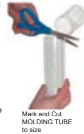
Mark and Cut MOLDING TUBE to size

1. Remove the contents of your kit. The first step is to cut the empty tube to size. With your Penis fully erect, hold the PERMANENTLY SEALED END against your body next to your Penis, and mark the tube where your Penis ends. At this mark completely cut off the excess tube with a pair of scissors. Now tape around this freshly cut edge with Duct Tape to make it smooth. This tube will be pressed against your body to make the mold.