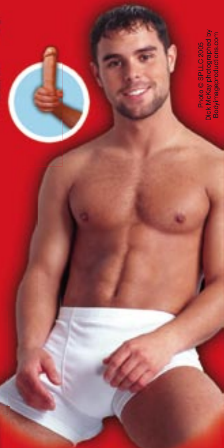
Dick Morley