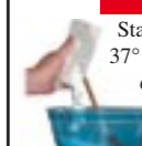
Pulver und Wasser mischen

3. Wenn Sie bereit sind, den Abguss herzustellen: Sie haben HÖCHSTENS 2 Minuten Zeit, um das Wasser mit dem Pulver zu mischen UND Ihren erigierten Schwanz einzuführen. Starten Sie Ihre Stoppuhr und geben Sie das 37° C warme Wasser aus dem Messbecher in die Schüssel. Schütten Sie das Gussformpulver ins Wasser und VERMISCHEN Sie das Ganze GUT mit einem großen Löffel oder Schneebesen. Schütten Sie die Mischung vorsichtig in die Gussröhre. Kratzen Sie mit Ihrem Löffel so viel aus der Schüssel wie möglich, aber beachten Sie bitte, dass die Mischung bereits nach 2 Minuten ausgehärtet ist!