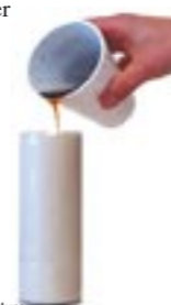
Pour in the Rubber Mixture

6. Mix up the Rubber with the Stir Stick. Stir vigorously until THOROUGHLY mixed (stir about 2 whole minutes). Be sure to mix THOROUGHLY! Now pour this rubber mixture into your mold, filling it to about an inch (2.5cm) below the rim.