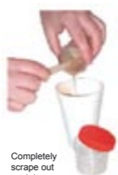
Completely scrape out each jar

5. For the best results let your mold air dry for a few hours before continuing Open the bottles of Liquid Rubber & Liquid Skin. Carefully Pour the ENTIRE contents of each bottle into a clean container (a strong paper cup works well). Use the enclosed stick to scrape out the ENTIRE CONTENTS of both jars.