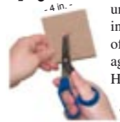
Cut an 'X' in your piece of cardboard

7. Take your 4" (10cm) piece of cardboard and cut a small 'X' in the center. Push the vibrator through the cardboard until only the screw cap sticks out one end. Carefully insert this vibrator/cardboard assembly into the center of your rubber-filled mold until the cardboard rests flat against the rim of your tube. Let this set for a full 24 Hours. Touch the rubber to make sure it's fully cured (hard) and carefully remove your new replica from the mold. Remove the cardboard and cut away any excess rubber with a sharp knife. Your Vibrating Dildo is now complete! It's permanent, easy to clean with soap and water, and lots of fun! TELL A FRIEND! www.cloneawilly.com