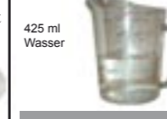
Erhitzen Sie Wasser und lassen es auf 37° C abkühlen:

2. WICHTIG: Lesen Sie sich Schritte 2-4 durch, bevor Sie Ihren Abguss herstellen. 425 ml Wasser Messen Sie genau 425 ml von 37° warmem Wasser ab. Erhitzen Sie Wasser und lassen es auf 37° C abkühlen: Halten Sie Ihr Thermometer unter den Wasserhahn und kaltes Wasser so lange, bis es 37° 98°F erreicht. Füllen Sie jetzt den Messbecher mit 425 ml Wasser. Rühren Sie um und messen Sie die Temperatur noch einmal, um sicherzustellen, dass es genau 37° warm ist.