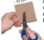
Coupez un « X » dans un morceau de carton de 10cm

7. Prenez votre morceau de carton de 10 cm et coupez un petit « X » au centre. Poussez le vibrateur à travers le carton jusqu'à ce que le bout de la vis ressorte. Insérez délicatement cet assemblage vibrateur/carton au centre de votre moule rempli de caoutchouc jusqu'à ce que le carton touche à plat le bout du tube. Laissez ainsi pendant 24 heures. Touchez le caoutchouc pour vérifier qu'il a complètement durci et retirez délicatement votre réplique du moule. Retirez le carton et coupez tout excédent de caoutchouc avec un couteau. Votre gode vibrant est prêt ! C'est permanent, facile à nettoyer avec du savon et de l'eau. Racontez à vos amis ! www.cloneawilly.com